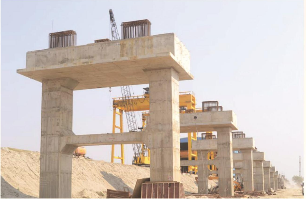
ब्रह्मपुत्र पर निर्माणाधीन बोगीबिल पुल का साउथ वायडाक्ट का दृश्य