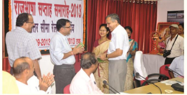
प्रश्नोत्तरी प्रतियोगिता के विजयी को पुरस्कार प्रदान करते हुए महाप्रबंधक/नि.

कहा। इस अवसर पर अधिकारियों के लिए एक प्रश्नोत्तरी प्रतियोगिता कराई गई जिसमें सभी अधिकारियों ने बद्ध-चढ़कर हिस्सा लिया। इस समारोह के साथ ही निर्माण संगठन में हिंदी-सप्ताह, 2013 की शुरुआत हुई। राजभाषा सप्ताह के उपलक्ष्य में राजभाषा अनुभाग/निर्माण द्वारा विभिन्न प्रतियोगिताओं एवं कार्यक्रमों यथा कर्मचारियों के लिए हिंदी टिप्पण एवं प्रारूप लेखन, निबंध, हिंदी वाक् तथा रेलकर्मियों के बच्चों के लिए हिंदी कविता पाठ प्रतियोगिता का आयोजन किया गया है। दिनांक 20.09.2013 को विभिन्न प्रतियोगिता के सफल प्रतिभागियों के बीच महाप्रबंधक/नि के कर कमलों द्वारा पुरस्कार प्रदान के साथ ही समारोह का समापन घोषित किया गया।